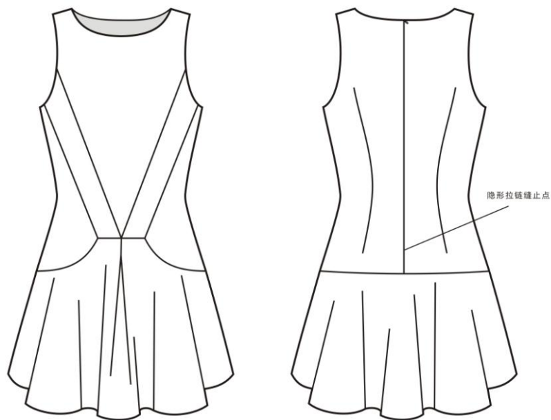
图 1 连衣裙款式图

参赛者会在比赛现场得到一块面料小样以及一张连衣裙款式图，根据面料特性，为提供的连衣裙款式图搭配，进行女士上衣系列服装设计，并绘制款式图。参赛者可使用主办方提供的人形绘图模板在 A3 尺寸的稿纸上绘制黑白服装款式图（包含背面图），并统一使用黑色绘图笔绘制。